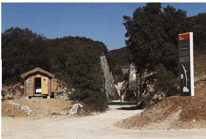
ATAPUERCA : Entrée des sites

Nous vous espérons donc nombreux à ce rendez-vous, fixé comme à l'accoutumée, sous la coupole de l'amphithéâtre du Muséum d'Histoire Naturelle, à 9 h 30.