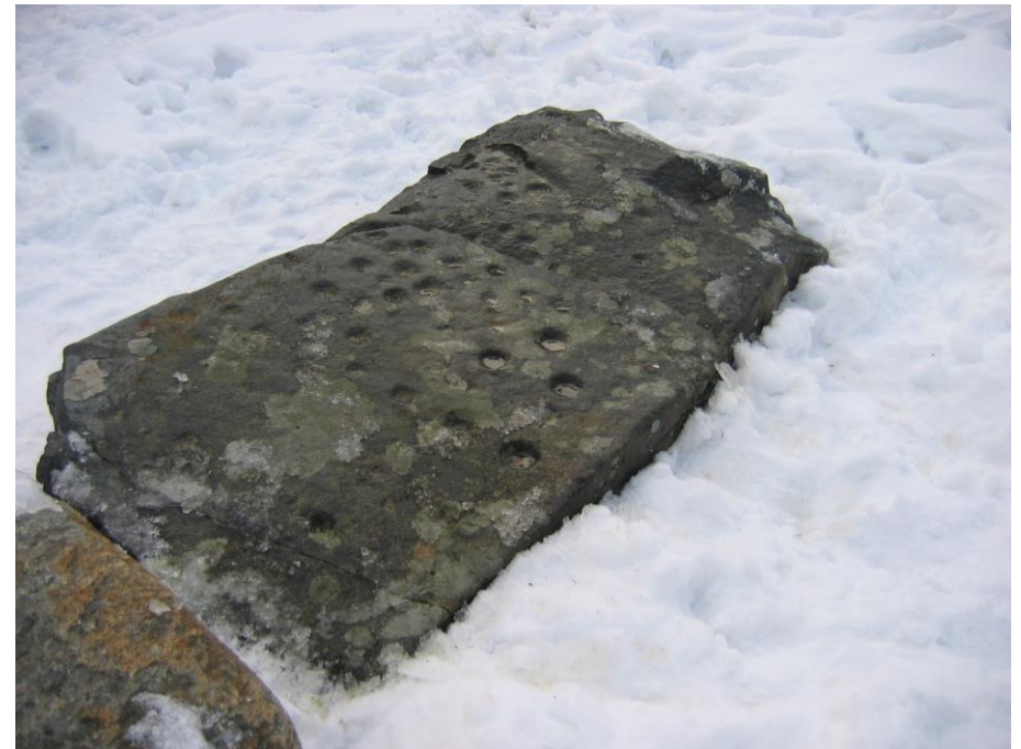
Cupules sur une dalle funéraire néolithique de Saint-Hilaire-du-Touvet (Isère).

Si, en Europe, leur signification nous échappe souvent, on possède ailleurs dans le monde des éléments d'explication grâce aux observations ethnographiques. »