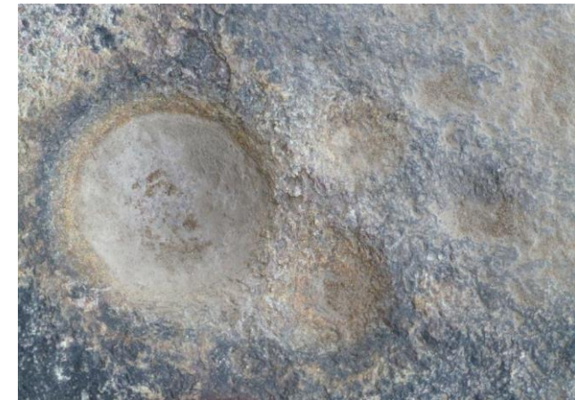
Plusieurs cupules au pied du baobab sacré de Nobéré, Burkina-Faso.

En examinant la roche au pied du baobab, j'ai immédiatement remarqué une grosse cupule, d'environ 11 cm de diamètre et profonde de plusieurs centimètres. Elle est entourée de quatre cupules à peine marquées, d'un diamètre de 3 cm environ. La grande cupule portait encore la trace d'un récent sacrifice, son fond étant tapissé d'une pellicule blanchâtre, probable bouillie de mil.