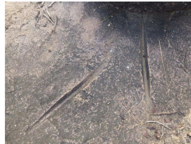
Site de Nobéré, Burkina-Faso.