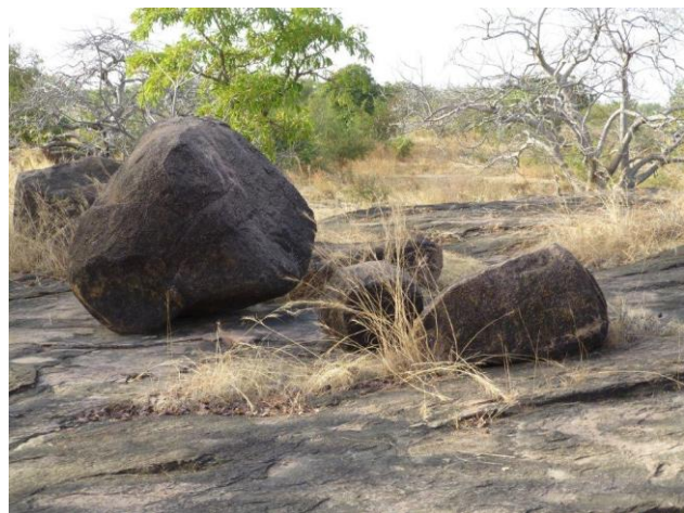
Site de Nobéré, Burkina-Faso.

Des blocs rocheux alignés sur l'affleurement semblent délimiter l'espace. Si la destination de la structure ne peut être précisée, il est néanmoins certain qu'il ne s'agit pas d'un chaos, mais bien d'un aménagement intentionnel.