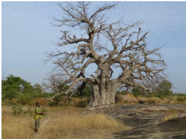
Baobab sacré de Nobéré, Burkina-Faso.

Alors que nous questionnions des habitants sur les sites à visiter, l'un d'eux a proposé de nous montrer un baobab sacré. Il nous a guidés, en brousse, jusqu'au lieu appelé Pougnerkougri, à quelque distance de Nobéré ; là, se dresse un baobab majestueux, dont la taille du tronc accuse l'âge vénérable.