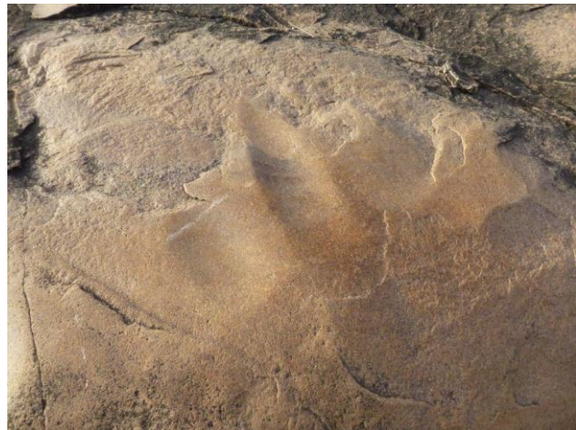
Site de Nobéré, Burkina-Faso.

d'aire de battage, et des plages de polissage, dont la patine atteste un abandon ancien.