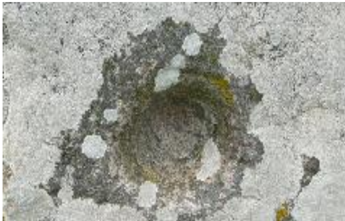
Une des cupules du menhir dressé à l'entrée du dolmen en "L" des Pierres Plates à Locmariaquer (56).