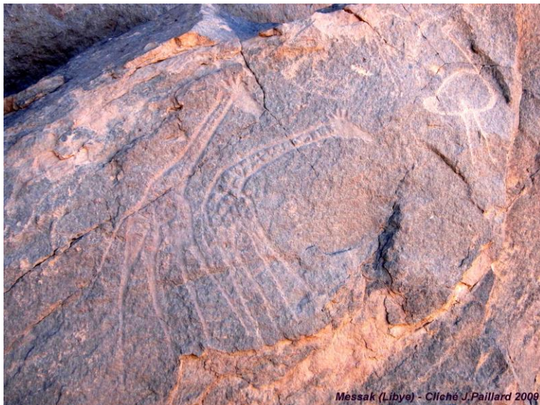
Messak (Libye) - Cliché J. Paillard 2009

« Approche de l'art rupestre dans le Sahara central. »