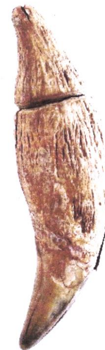
Dent d'ours à rainure pour la suspension de la Grande Brière. Longueur: 94 mm.

R. Agache a signalé une molaire d'ours provenant de Saint-Acheul, présentant une racine perforée (fig. 3). L'Abbé Breuil qui a examiné la pièce exclut le Paléolithique. R. Agache penche plutôt pour le Néolithique local