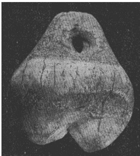
Molaire d'ours de Saint-Acheul (d'après R. Agache, échelle non indiquée).

mais, en l'absence de tout contexte, la Protohistoire peut aussi bien être envisagée.