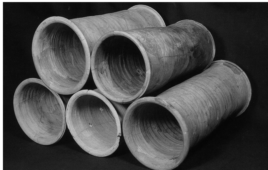
Figure 2 - Ruches céramiques de Tossal de San Miquel (Lliria), III-II e s. avant J.-C. (Photo extraite de « La Fonteta Ràquia... », par P. Jardon et al.).

l'absence de pierres sous certaines concentrations de tessons de ruches laissent croire que celles-ci pouvaient faire partie de constructions en terre ou en bois qui ne se seraient pas conservées. »