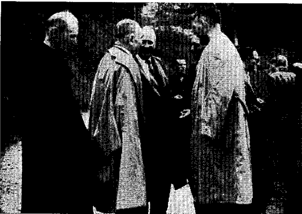
Après la visite de l'Abri Pataud.