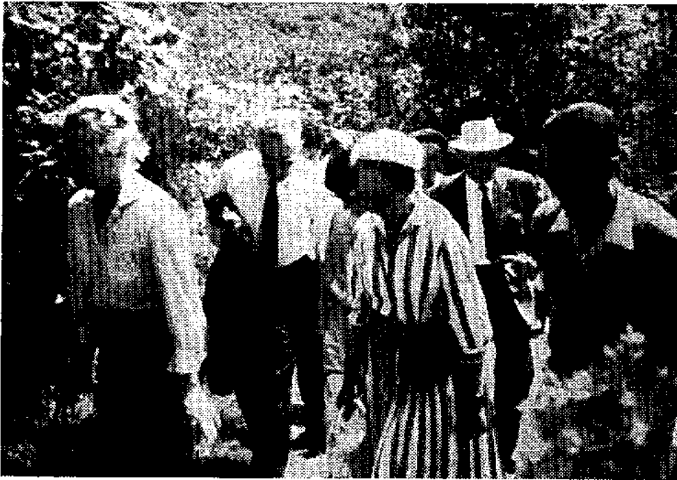
Le groupe remonte le sentier de Laussel.