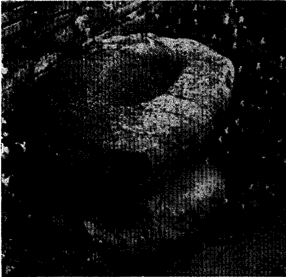
Fig. 1 - Laverasse de "La Baillère" S t -Mesmin-le-Vieux (Vendée)