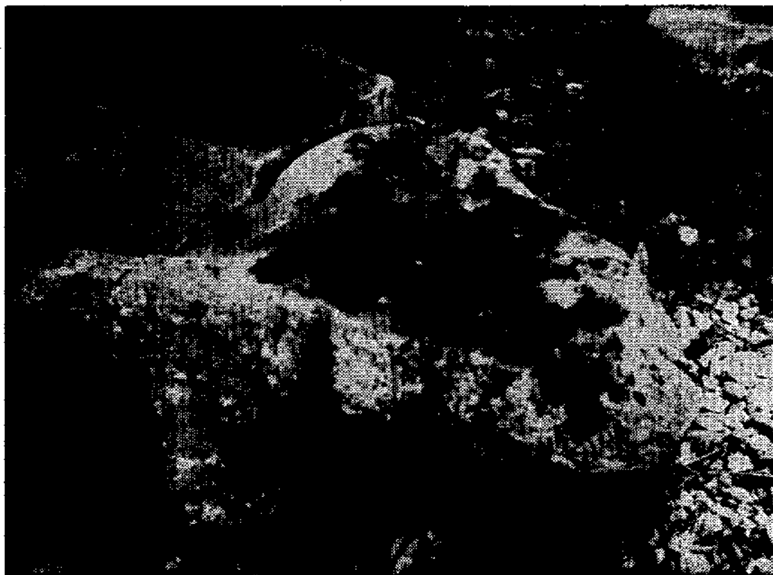
Fig. 4 - Pierre à bassins jumelés de la Veillerière, S t -Mesmin-le-Vieux (Vendée)