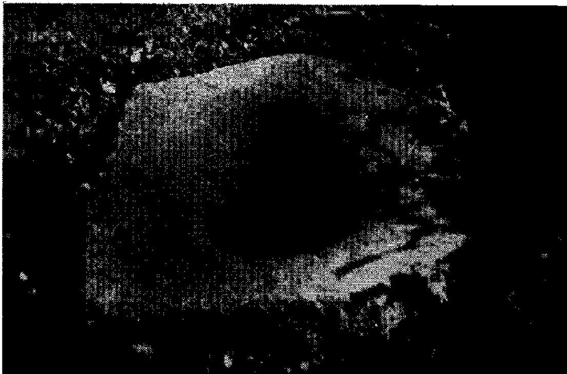
Fig. 3 - Pierre à bassin du Rémy, S t -André-sur-Sèvre (D.-Sèvres)