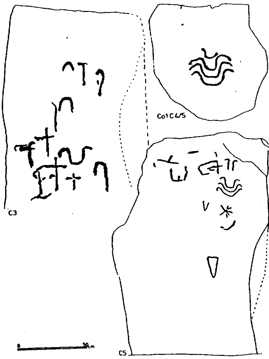
Mant Lud, Locmarisquer. C3, C5, ColC4/5.

D'après E.S. TWHIG. The Megalithic Art of Western Europe