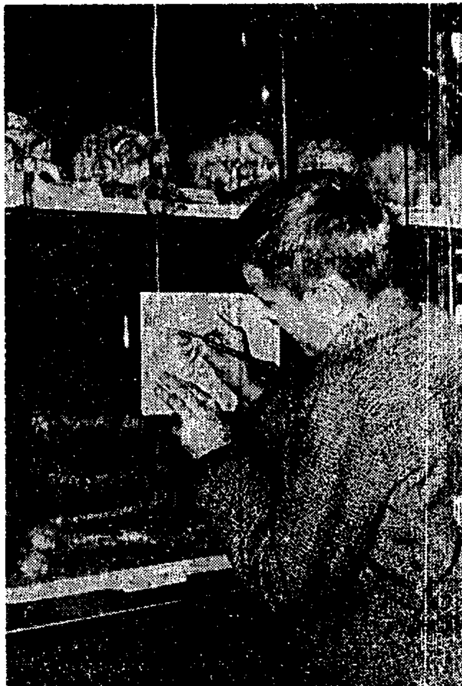
Cet écolier studieux dessine sur son carnet les cranes de nos ancêtres