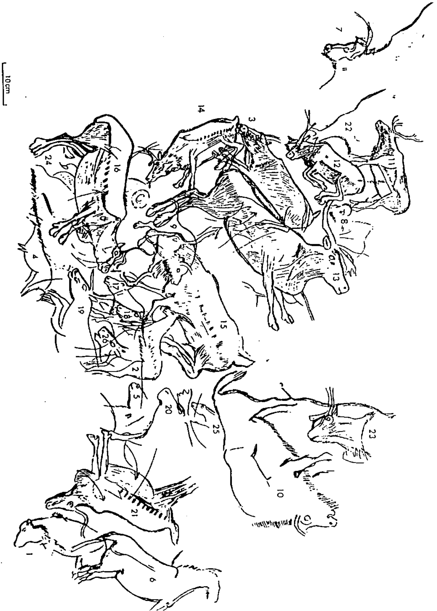
figure 2 : l'ensemble 11 -panneau 2, dans le Sanctuaire