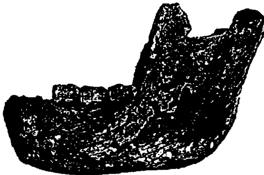
La mandibule humaine de Montmaurin, découverte par R. Cammas dans la "Niche"