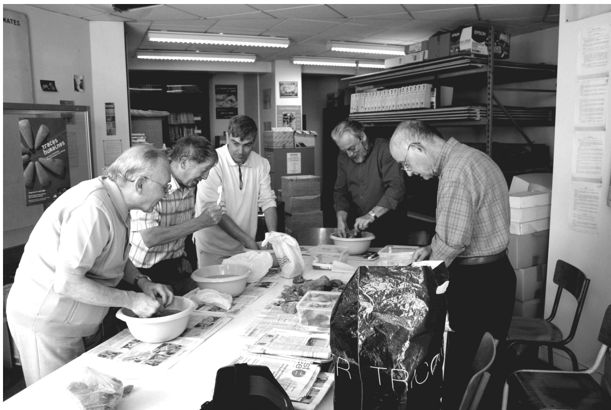
Fig. 1 : Le Plessis-Martin, Nort-sur-Erdre (44) – séance de lavage du mobilier du 19 mai 2007.

La séance de lavage du mobilier récolté sur le site du Plessis-Martin fut rapide. Les sept personnes présentes n'eurent besoin que de peu de temps et surtout d'un coup de brosse à dent agile pour nettoyer plus d'une centaine de pièces (Fig. 1).