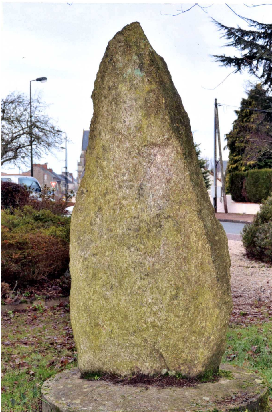
« Menhir d'Obélix »

Il mesure 76 cm à la base, 90 cm au plus large et 1m 82 de hauteur hors sol.