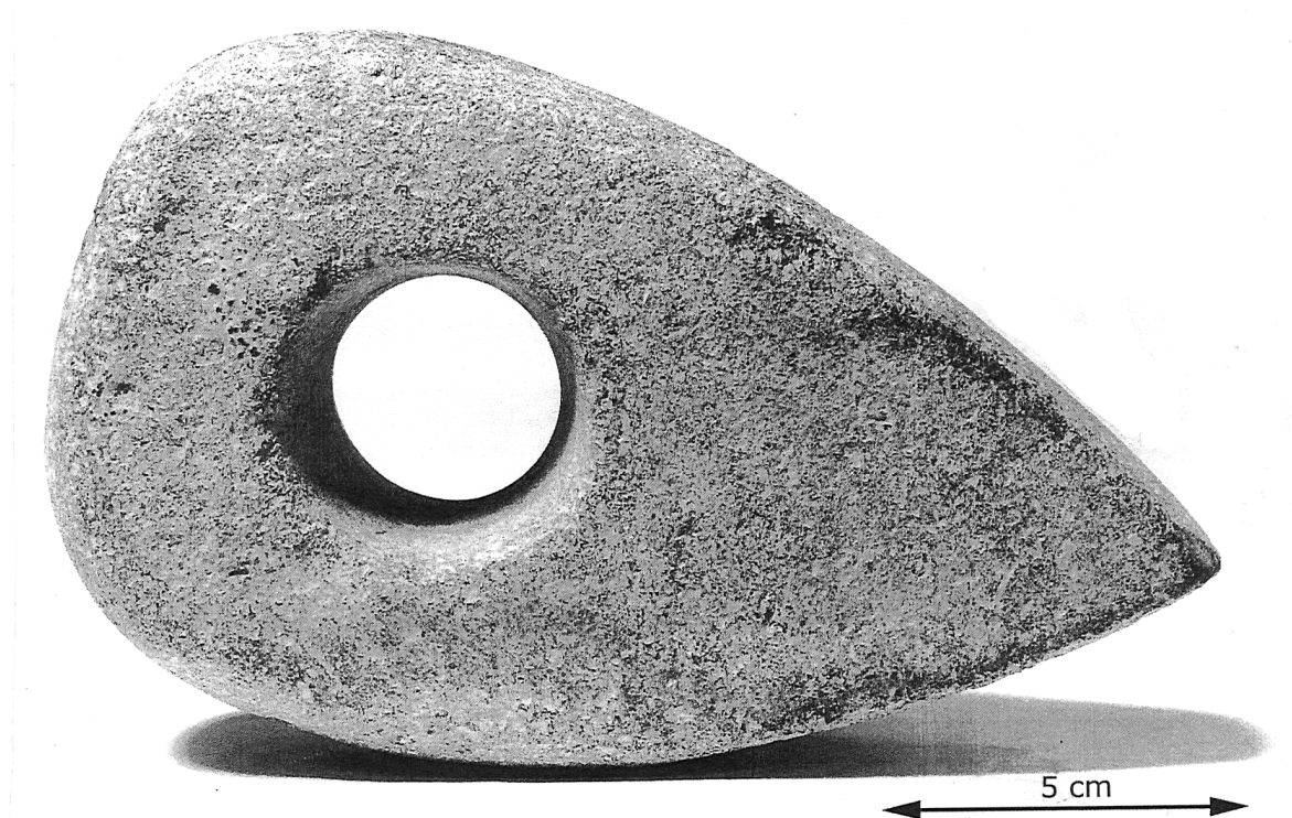
SION-LES-MINES – Menhir de Briangault (44) : Hache-marteau

Cet objet peu commun a été présenté dans la vitrine bicentenaire du Muséum de décembre 2010 à janvier 2011.