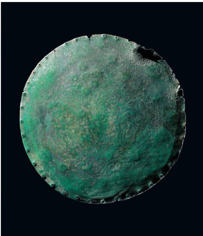
Disque de Nebra - verso

Sur le revers, les coups de marteau du forgeage sont visibles; sur la bordure du disque, au moins 38 trous ont été percés à intervalles réguliers, dans une phase ultérieure à celle de la fabrication. Le disque a-t-il été fixé sur un support ?