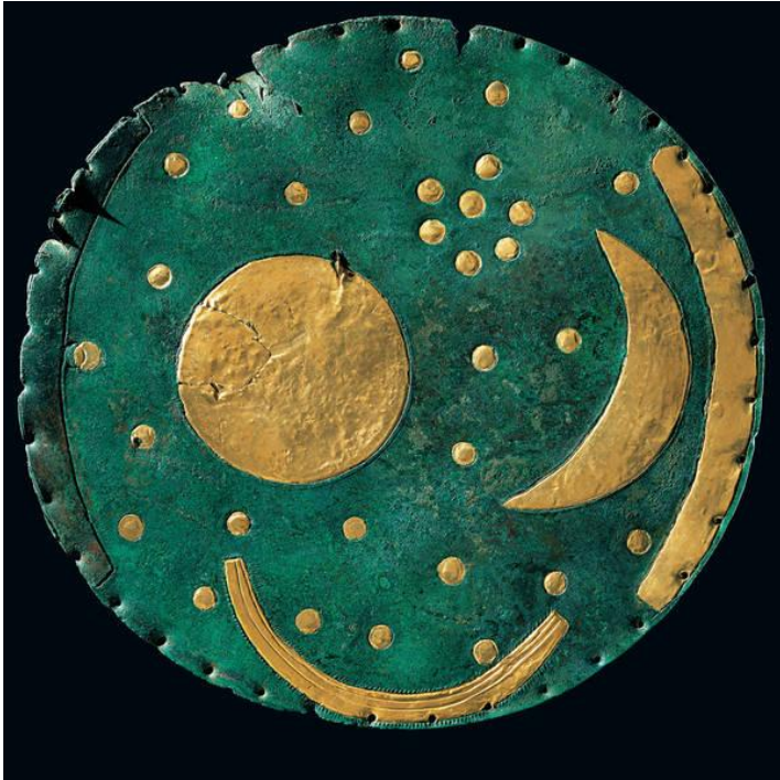
Disque de Nebra - recto

On remarque également l'insertion de 37 pastilles d'or de 0,4 mm d'épaisseur, leurs bords ayant été pressés par martelage à l'intérieur de minces gorges.