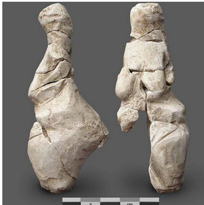
"Vénus de Renancourt" Stéphane Lancelot – INRAP

Paléolithique supérieur, période à laquelle les territoires des pays actuels du nord de l'Europe, y compris les Pays-Bas, étaient recouverts par les glaciers.