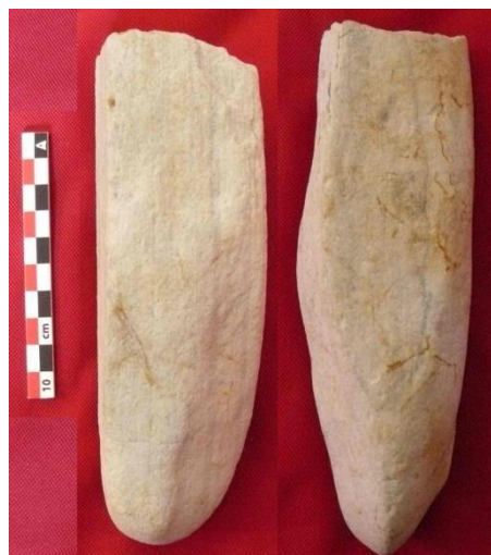
Fig 3 – Nozay/La Servais (44) : mobilier lithique

La pièce, difficile à déterminer, n'a pas recueilli d'avis consensuel de la part de ses observateurs : il pourrait s'agir d'un aiguiseur ou d'un « pic », ou même, encore, pourrait-elle être tout simplement le résultat d'une usurenaturelle.