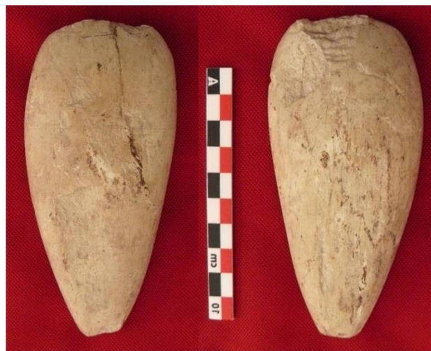
Fig 2 – Nozay/La Servais (44) : mobilier lithique néolithique,