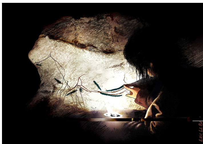
(Illustration : Eric LE BRUN)

Située au cœur de la vallée « de l'Homme », le long de la rivière Vézère en Dordogne, la grotte des Combarelles I (Les-Eyzies-de-Tayac) est connue pour la qualité de son art gravé attribué au Magdalénien. Le long des 500m 2 de parois se mêlent d'innombrables chevaux, aurochs, rennes et bisons souvent réalistes et très détaillés. Ces gravures spectaculaires ne sont cependant pas les seuls témoignages artistiques du dispositif pariétal. En effet, parmi les animaux et en lien avec eux, se logent de nombreuses traces colorées, noires et rouges, qu'une mauvaise conservation a souvent rendues peu lisibles.