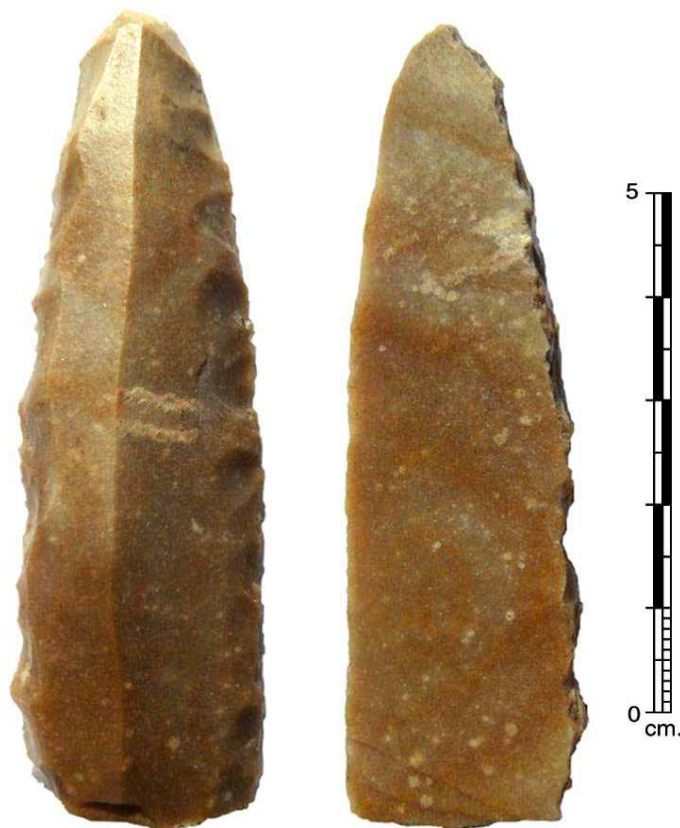
Fig. 1 : Ile de Kergol, GUERANDE (44) - poignard pressignien.