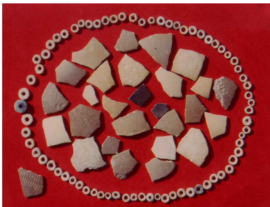
Fig. 3 : Oued Zegag, SUD ALGÉRIEN - collier de perles, fragments de coquilles d'œufs d'autruche.