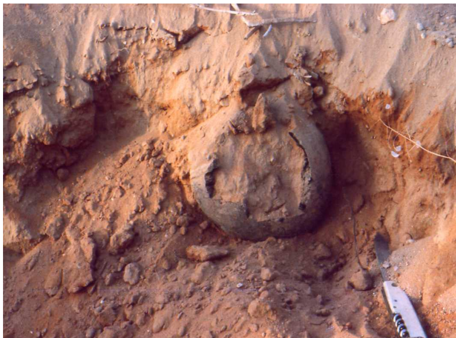
Fig. 2 : Oued Zegag, SUD ALGÉRIEN - vase.