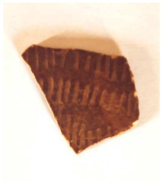
Fig. 5 : Oued Zegag, SUD ALGÉRIEN - fragment de coquille d'œuf d'autruche gravé