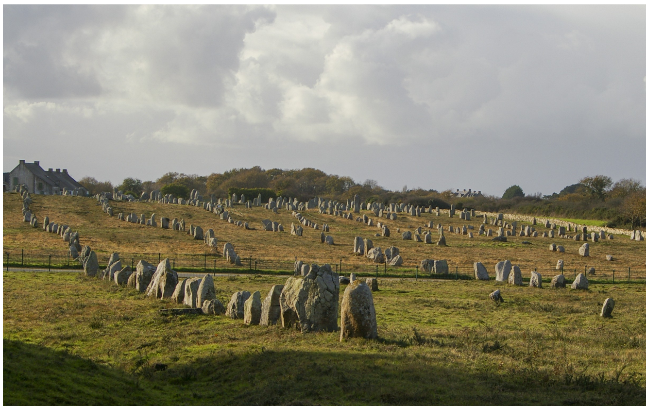
Le Menec vu de l'Est

« Les champs de menhirs de Carnac : approche géomorphologique »