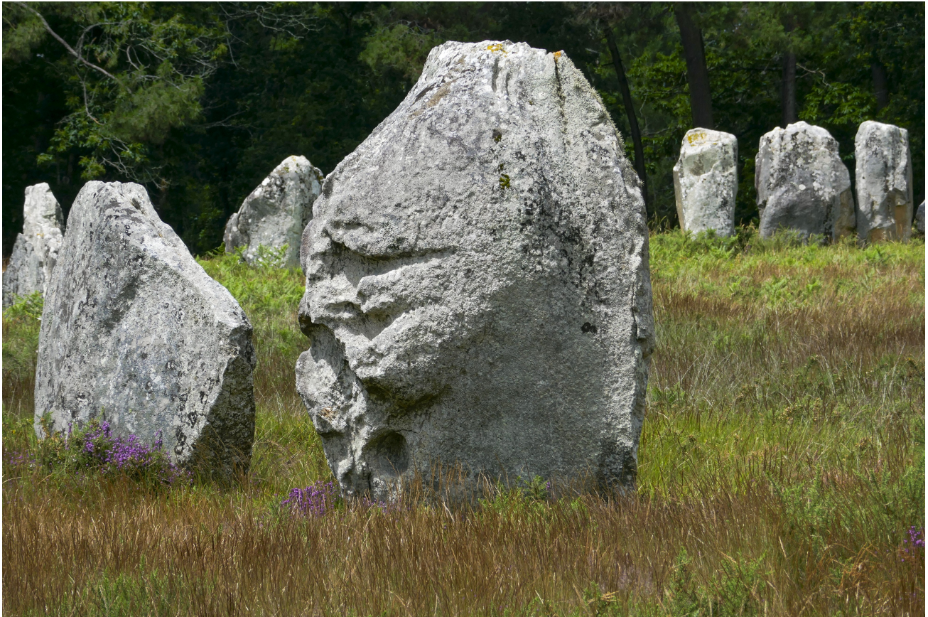
Menhir de Kerlescan

Par ailleurs, la plupart des menhirs présentent deux types de faces opposées : les faces d'affleurement , qui se trouvaient à la surface de rochers dépassant du sol avant l'édification des alignements, et des faces d'arrachement , mises au jour lors de l'extraction des blocs de granite employé. Cette propriété morphologique des menhirs suggère la présence de nombreux rochers et affleurements de granite à l'emplacement ou à proximité des alignements avant leur construction.